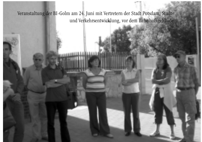
Veranstaltung der BI-Golm am 24. Juni mit Vertretern der Stadt Potsdam, Stadt- und Verkehrsentwicklung, vor dem Bahnhofsgebäude