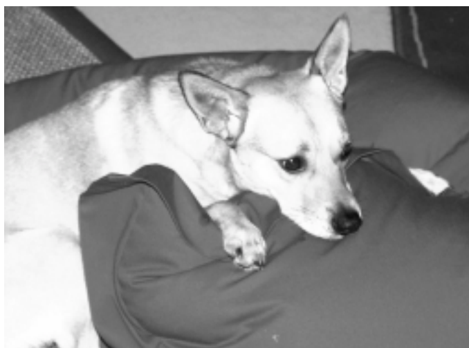
Auch ein Terrier braucht mal eine Pause, wenn er in die Jahre kommt...

Aber glauben Sie nicht, dass Ihr Hund, nur weil er jetzt eine „ruhige Kugel schiebt“, am Leben nicht mehr interessiert ist! Anstrengende Hundesportarten und „Marathon-Läufe“ sind jetzt zwar out, aber neben den täglichen kleinen Spaziergängen können Sie Ihren Hund geistig durch Spiele auslasten und so für Abwechslung im Hundealltag sorgen, ohne ihn zu überanstrengen. Genießen Sie mit Ihrem Hund das Leben und lassen Sie sich etwas einfallen, damit Ihr Hundesenioren körperlich und geistig so lange wie möglich fit bleibt.