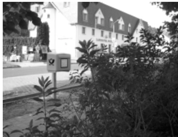
Golm hat wieder einen Briefkasten.