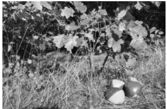
Schöner Herbst in Golm - kann aber auch viel Arbeit machen mit dem abfallenden Laub.

Die vollständige Liste der Vertriebsstellen ist unter www.potsdam.de abrufbar oder kann bei der Abfallberatung unter der Telefonnummer 0331-289-1796 angefordert werden.