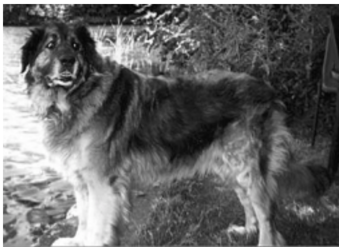
In Ehren ergraut: Alysa, ein Leonberger.

Alternde Hunde sind liebenswerte Gefährten. Sie haben schon lange keine Flausen mehr im Kopf und wissen ganz genau, wer das Sagen hat. Sie haben es nicht mehr nötig, die Rangordnung auf die Probe zu stellen. Das Zusammenleben mit einem alten Hund sollte geprägt sein von gegenseitigem Einvernehmen mit Achtung und Toleranz.