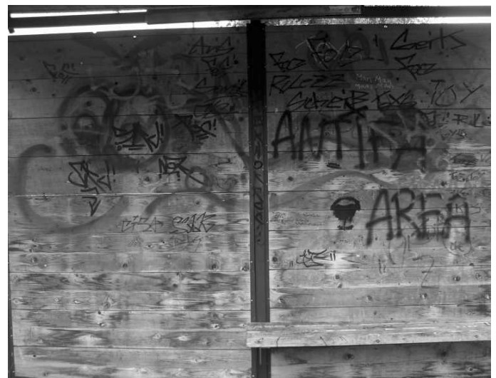
Oben: Reiherbergstraße, Mitte: Tunnel am Bahnhof, unten: Bushaltestelle Kirche, rechts: Geiselberstraße.